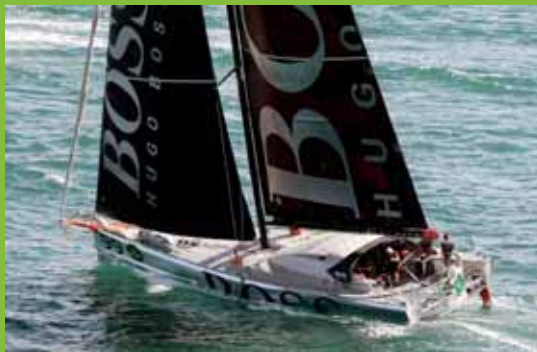
IMOCA 60 HUGO BOSS