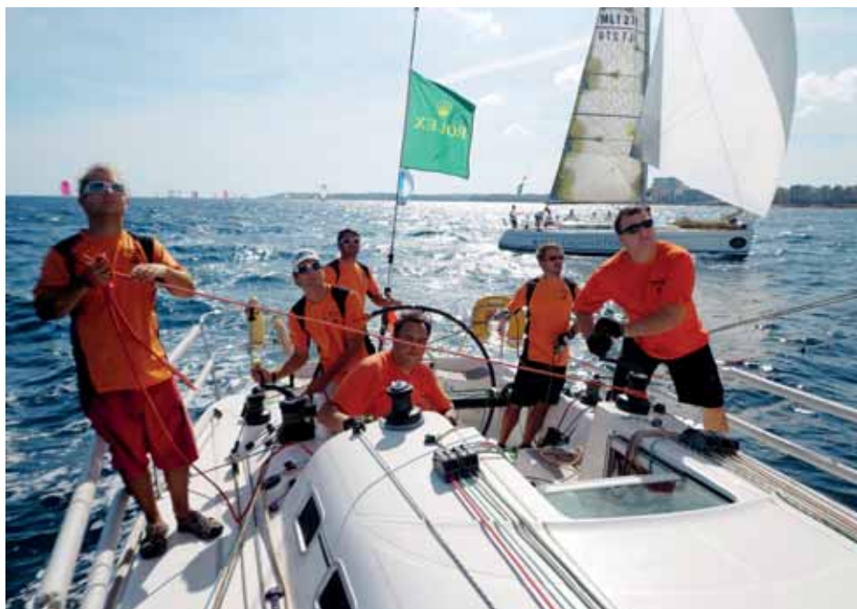
Na palubě Firstu 40.7 THREE SISTERS

Ráno nám pohled na výsledky přináší zaslouženou satisfakci: ve skupině jsme stíhací jízdou v druhé polovině závodu dosáhli na 3. místo a celkově jsme dvanáctí.“