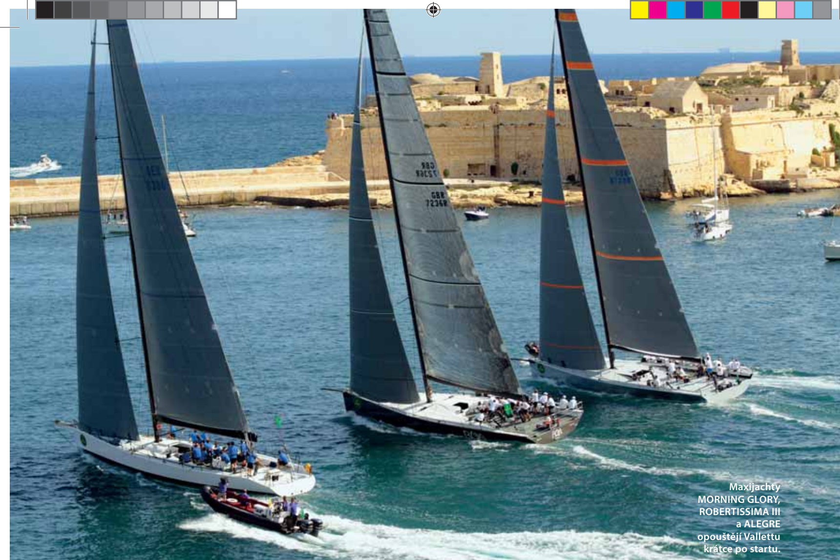
Maxijachty MORNING GLORY, ROBERTISSIMA III a ALEGRE opouštějí Vallettu krátce po startu.

Být na startu jakéhokoli velkého závodu plachetnic je vždy obrovský zážitek. A start 34. ročníku Rolex Middle Sea Race byl vskutku impozantní. Nejen proto, že hlavní záliv komerčního přístavu ve Vallettě zaplnila bezmála stovka lodí a že břehy byly totálně obleženy diváky, ale také pro nádherné pískovcové stavby tvořící působivé kulisy a samozřejmě dvě české lodě v závodě.