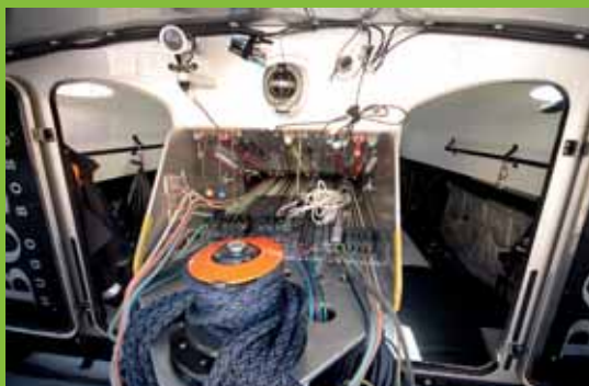
Zde se ovládá takeláž.