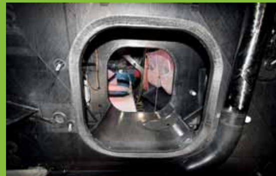
Vstup do skladiště plachet