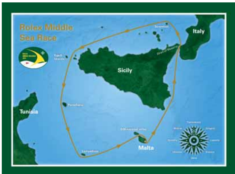
Přes 600 Nm dlouhá trasa závodu vede z Valletty Messinou ke Stromboli kolem Sicílie na Pantallerii, Lampedusu a zpět na Maltu.

jíždíme kanálem mezi Maltou a ostrovem Gozo a po půl dvanácté v noci vjíždíme do zálivu, kde nás čeká cíl. Dech beroucí adrenalinová show na závěr: fouká téměř nula a půl míle k cílové bojce se potácíme 50 minut! Nakonec jsme tam v čase 4 dny a 13 hodin a jsme přiměřeně šťastní! Ráno nám pohled na výsledky přináší zaslouženou satisfakci: ve skupině jsme stíhací jízdu v druhé polovině závodu dosáhli na 3. místo a celkově jsme dvanáctí.“