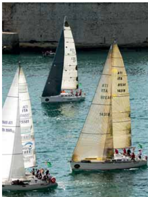
Po kolizi na startu se TŘI SESTRY SALING TEAM vydal na trať.