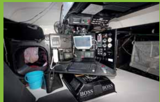
Navigační centrum, kde během sólových závodů tráví Alex až 12 hodin denně.