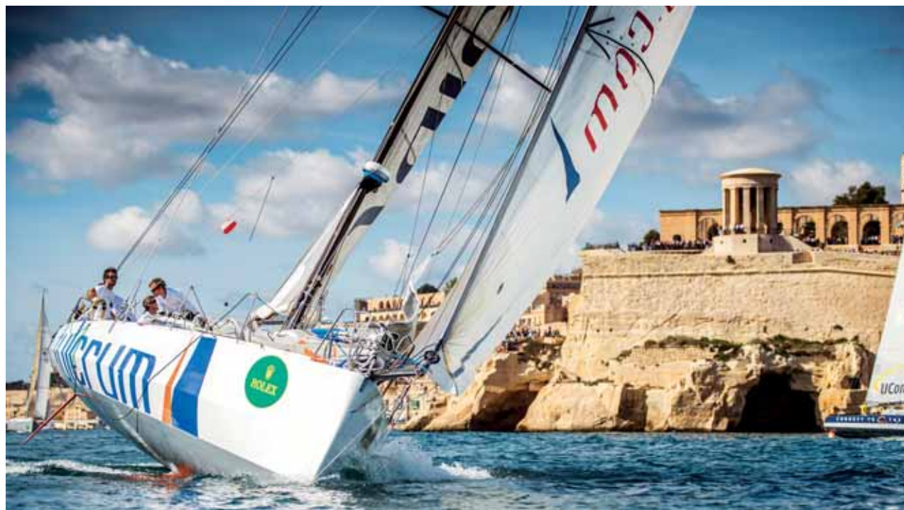
Česká loď FULCRUM vede flotilu ven z přístavu. -